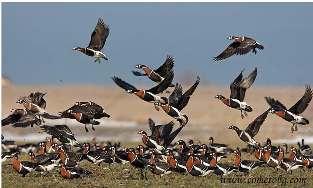
Rödhalsade gäss.