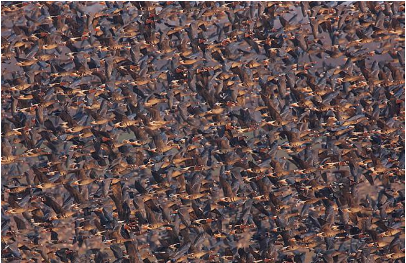
Galet många rödhalsade gäss och bläsgäss.

Dag 4: Vi besöker Durankulak och Shabla sjöarna - de viktigaste lokalerna för den hotade rödhalsade gåsen, samt för bläsgås. År 2013 inräknades det 53 000 rödhalsade gäss och ca en kvarts miljon bläsgäss i området! Det finns också chans för fjällgås, men det blir en verklig utmaning att finna den bland alla bläsgässen! Andra intressanta arter i området är bl a örnvråk och kalenderlärka. Middag och natt i Kavarna.