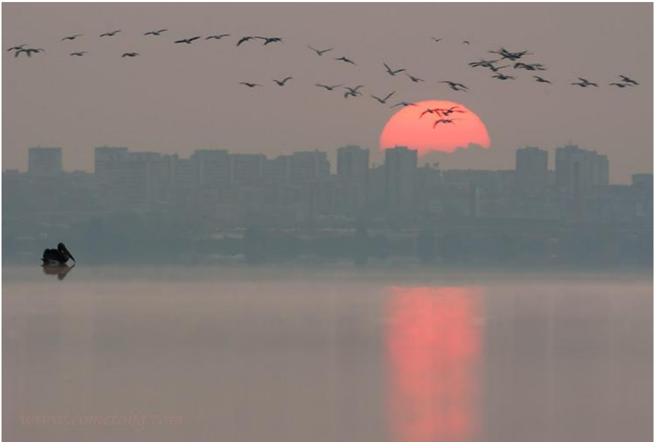
Pelikaner vid Burgas Lake.

Dag 1: Resan börjar på flygplatsen i Varna tidig eftermiddag, där vi möts av vår lokale guide, Lyubo, samt vår busschaufför. Skådningen börjar nästan omgående med ett stopp vid Varna-sjön, som brukar hysa vattenfågel i mängder. Därefter transfer ca 135 km till byn Sarafovo i Burgasområdet. Under körningen planeras ett par kortare skådarstopp vid Banya, samt vid mynningen av floden Kamchia. Middag samt natt på hotell Mirana i Sarafovo.